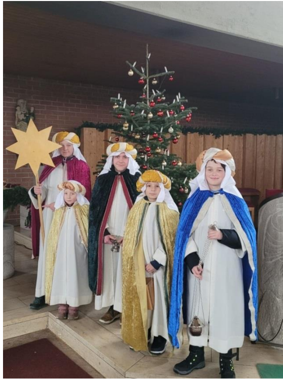
Sternsinger Reichenbach 2023