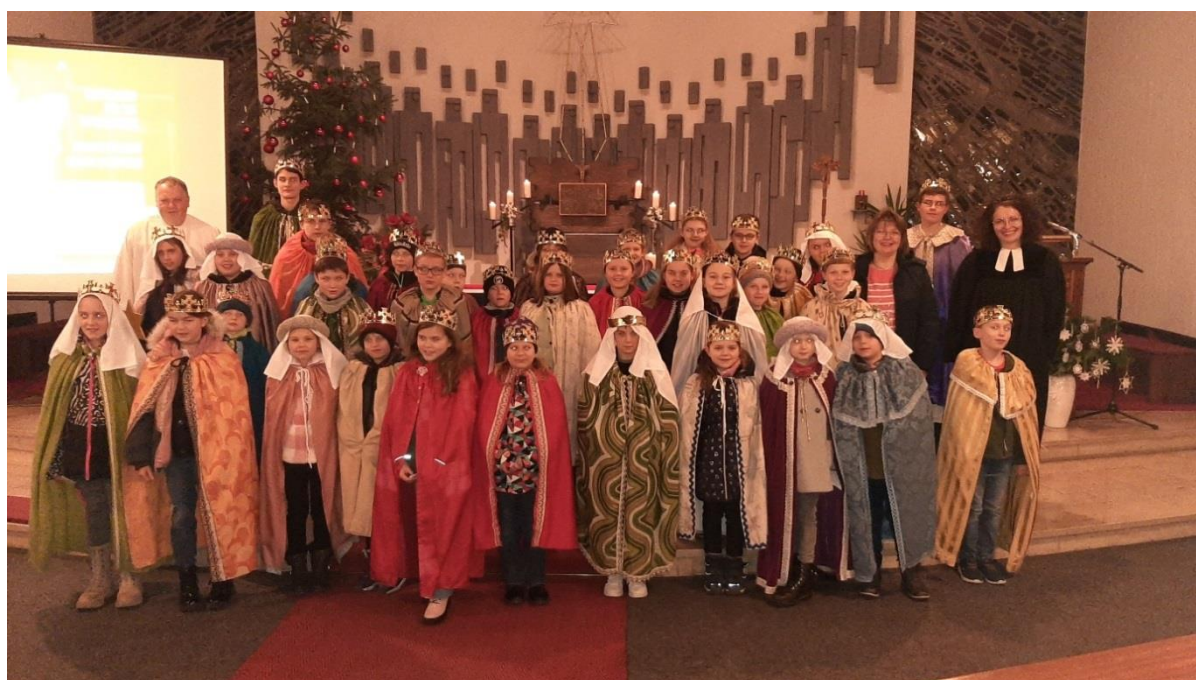
Sternsinger Ludwigsstadt 2023

Auch unseren Sternsingergruppen aus den einzelnen Ortschaften ein herzliches „Vergelt´s Gott“ für ihren Einsatz! Ihr seid SUUUUPER!!! 😊