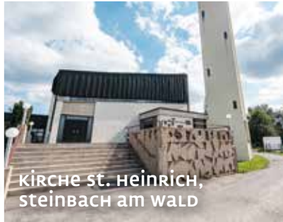
KIRCHE ST. HEINRICH, STEINBACH AM WALD