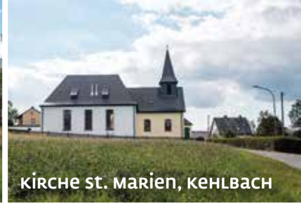
KIRCHE ST. MARIEN, KEHLBACH