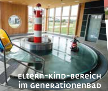
ELTERN-KIND-BEREICH im generationenbad