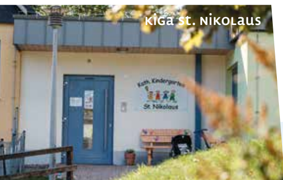
KiGa St. Nikolaus

Außenstelle der Frühförderstelle Im Lehen 13 96361 Steinbach am Wald 09263 99280-34 www.lebenshilfe-kronach.de > Kinder und Jugendliche > Frühförderstelle