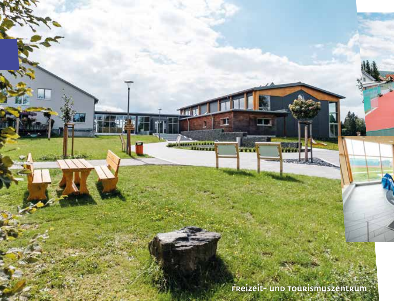
FREIZEIT- UND TOURISMUSZENTRUM