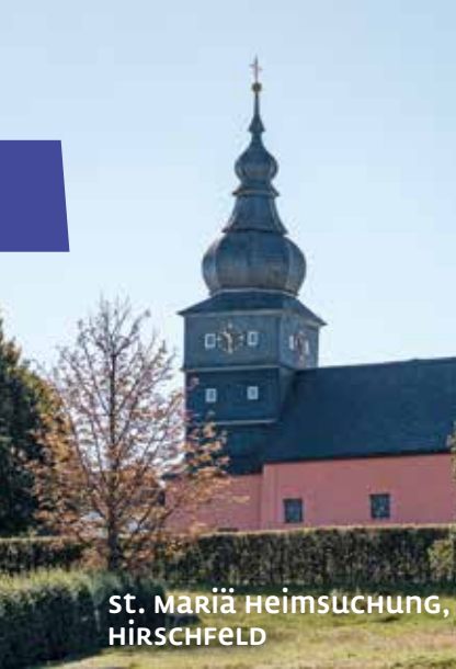
St. Mariä Heimsuchung, HIRSCHFELD