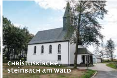
CHRISTUSKIRCHE, STEINBACH AM WALD