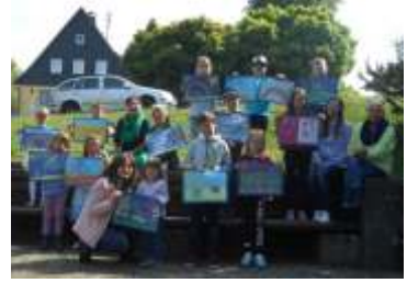
Kleine Malkünstler präsentieren ihre Kunstwerke beim Preisverleih

Besonderes Highlight war der Malwettbewerb mit Zuckerkreide. Fast 50 Bilder entstanden und ließen die Kreativwerkstatt in Farbenpracht erleuchten.