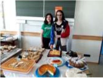
Stärkung mit leckeren Kuchen & deftigen Broten