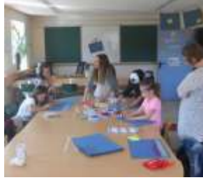
In der Kreativwerkstatt Kleine Künstler am Werk