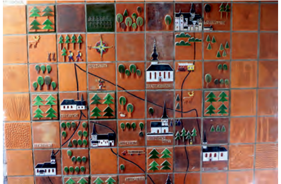
Das aussagekräftige, noch erhaltene historische Fliesenbild aus der Entstehungszeit des Zentrums Mitte der 70er Jahre, weist auf die Sehenswürdigkeiten rund um Steinbach am Wald hin.

Das vor vierzig Jahren eingeweihte Freizeitzentrum ist schließlich in die Jahre gekommen und entsprach nicht mehr den heutigen Erfordernissen. Neben einer hochkarätigen Bade-, Ess- und Freizeitkultur setzen die Steinbacher auf eine gezielte Präsentation der unterschiedlichsten Attraktionen im Frankenwald. Eigens dafür wurde eine Arbeitsgruppe einberufen, die sich aus Tourismus- und Heimatexperten aus der Region zusammensetzt.