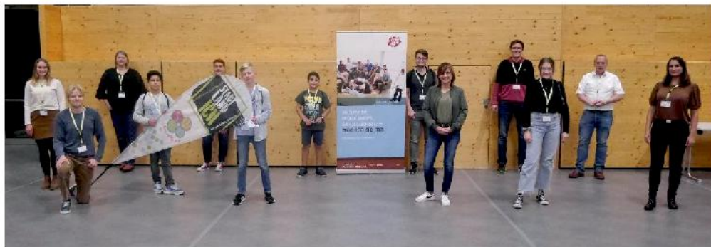
Teilnehmer der Chancenwerkstatt in Steinbach am Wald

Oberfranken Offensiv e.V. ist eine der mitgliederstärksten Regionalinitiativen Deutschlands und Impulsgeber für innovative Projekte. Die Stärken Oberfrankens vor dem Hintergrund des demographischen Wandels auszubauen und so die Zukunftsregion Oberfranken mitzugestalten, das haben wir uns als Entwicklungsagentur zur Aufgabe gemacht. Im Verein engagieren sich Kommunen, Unternehmen, Institutionen und Verbände genauso wie Privatpersonen.